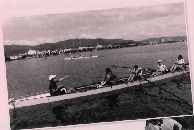
瀬田川でボートに乗ってみよう! (瀬田南学区)