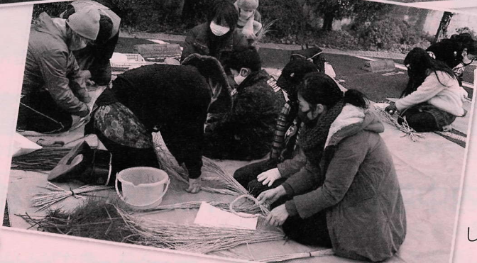
しめ縄作り(滋賀学区)