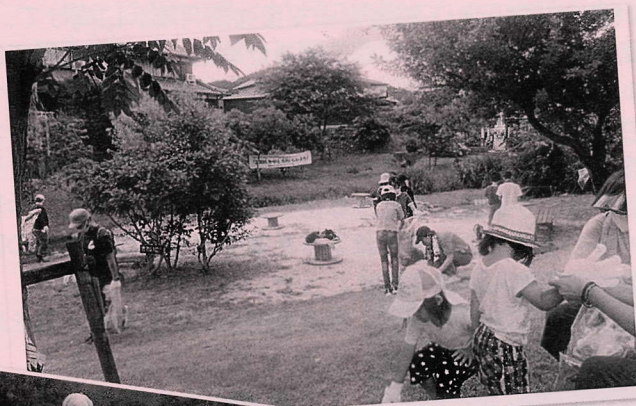
三田川水辺の 親子清掃(晴嵐学区)